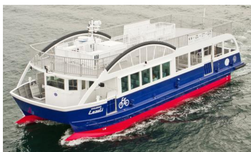
試運転中のサイクルシップ・ラズリ

【Lazuli】は青を意味するペルシア語に由来し、古代より直観力と創造力を高める力がある『聖なる色』として崇められてきました。サイクリストの聖地と呼ばれるしまなみ海道の海や島とサイクリングロード（ブルーライン）を本船が繋ぐことをイメージして命名しました。