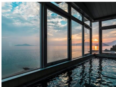
Uminos Spa&Resort（広島県 江田島市）