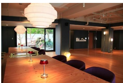
Guest Living Mu Nanki Shirahama（和歌山県 西牟婁郡白浜町）