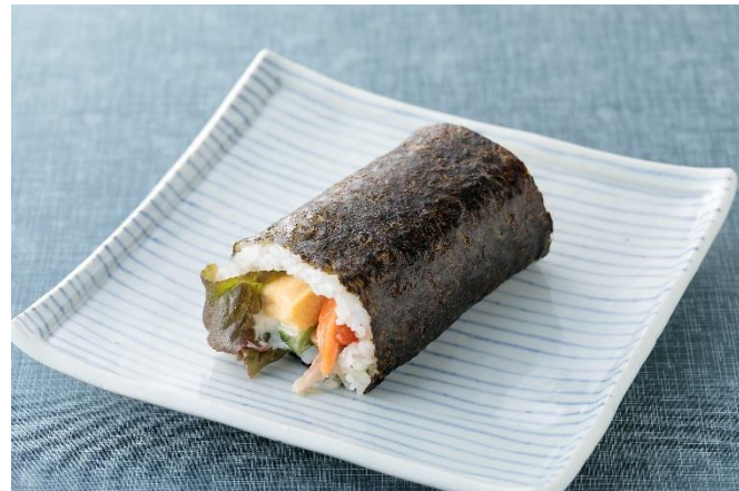
プロフィッシュ恵方巻