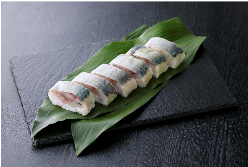
お嬢サバの棒寿司

※商品名や商品内容/価格(税込)は変更となる場合があります。また品切れの際はご容赦ください。