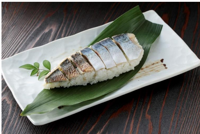
お嬢サバの姿寿司