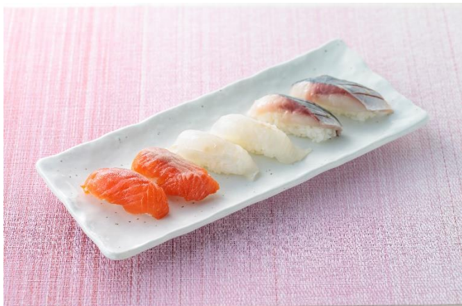
プロフィッシュ三種握り