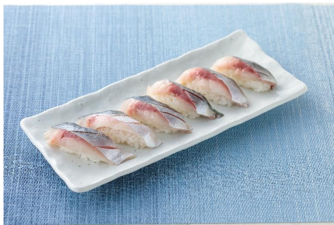
お嬢サバの生握り