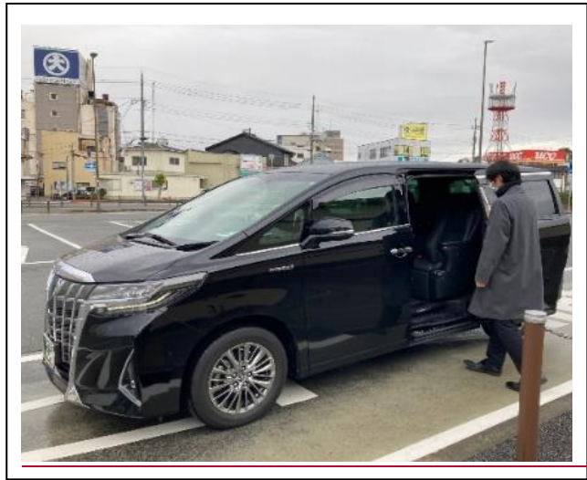
(城崎温泉・湯村温泉エリアでの一般ユーザー向けサービス実施の様子)