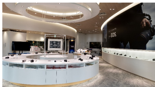
キヤノンフォトハウス大阪