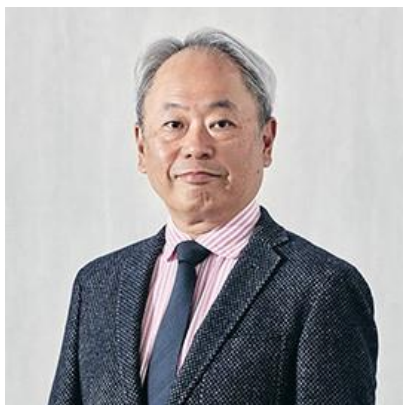
株式会社経営共創基盤 IGPI グループ 会長

パーパス経営について、その背景と実現の要件、経営課題について講演予定。 また後半では、JR 西日本グループのパーパス経営についてもトークセッションを実施。