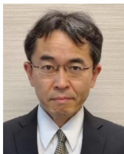
京都市副市長 坂越 健一