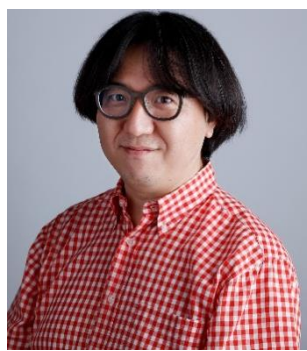
株式会社イチバンセン 代表取締役