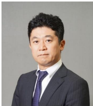
国土交通省 総合政策局地域交通課長