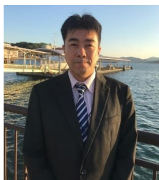
瀬戸内海汽船株式会社 取締役航路事業部長

せとうちエリアの観光型クルーザー「シースピカ」の導入経緯を例に、ビジネスの手法を通じた地域交通活性化と、持続可能な地域づくりに向けた次なる挑戦について語ります。