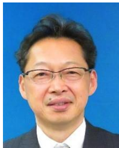
大阪市副市長 高橋 徹