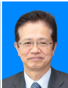
神戸市副市長 今西 正男