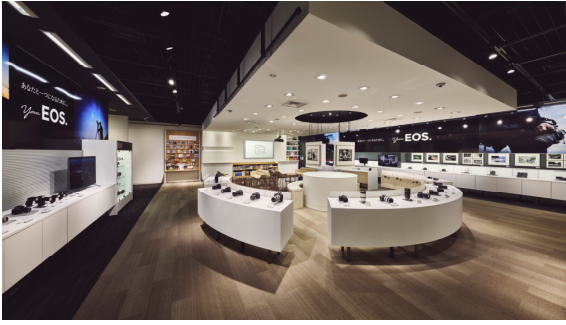
キヤノンフォトハウス銀座