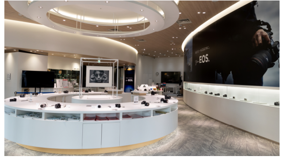
キヤノンフォトハウス大阪

キヤノンフォトハウス銀座・大阪会場では、銀座および大阪で10点ずつ、計20点の鉄道写真をパネルで展示します。