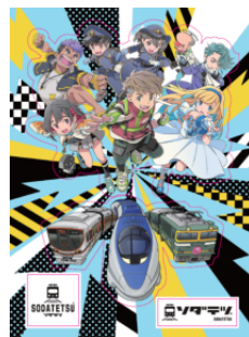
トレーディングカード