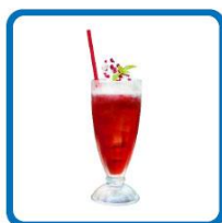
谷口太一おすすめ！ 甘酸っぱいグレナデンソーダ フロート 850円(税込)