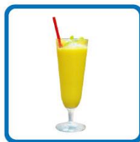
福田歩汰おすすめ！ 定番マンゴースムージー 850円(税込)