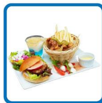
DXTEENの愛がギュッと詰まった DXTEENプレート 1,800円(税込)