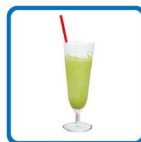
寺尾香信おすすめ！ 茶葉香る抹茶スムージー 850円(税込)