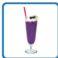
田中 実太郎おすすめ！ 濃厚フロースン ブルーベリーヨーグルト 850円(税込)