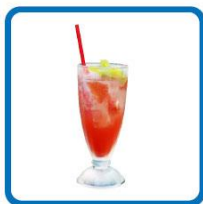
大久保涼留おすすめ！ 大人な趣味ピンクグレープフルーツと グレナデンのカクテル(ノンアルコール) 850円(税込)