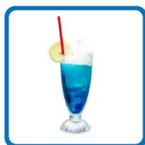
平本健おすすめ！ 爽やかブルーキュラソークリームソーダ 850円(税込)

大阪ステーションシティ5F 時空(とき)の広場にあるカフェ「パール・デルソーレ」に、「DXTEEN×バーチャル大阪駅 3.0」のスペシャルコラボカフェが期間限定で“リアル”でオープンします！DXTEENメンバー6人をイメージした、ここでしか食べられない期間限定コラボメニューも登場※！コラボメニューをオーダーいただいた方には、もちろん「DXTEEN×バーチャル大阪駅 3.0」オリジナルステッカーがもらえる！※コラボメニューの提供時間は11:00～21:30(ラストオーダー)まで